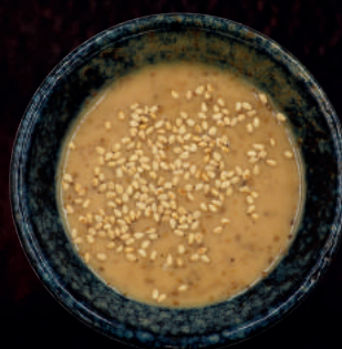
131. GOMA DRESSING