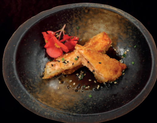
17. TEMPURA LAKS (2 STK.) Med hjemmelavet sauce