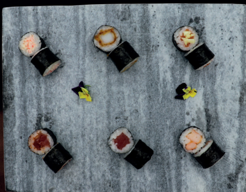
45. TUN MED CHILI