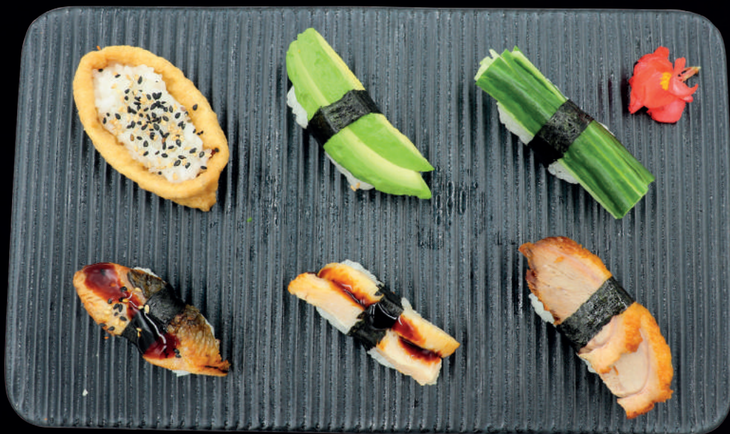
91. TERIYAKI ÅL