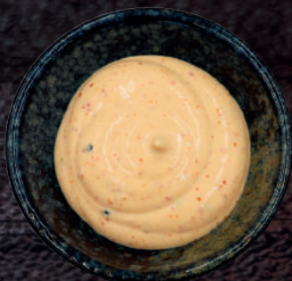
127. CHILIMAYO (MEDIUM)