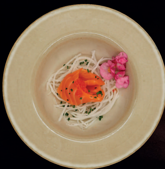
124. LAKS SASHIMI (3 STK.)