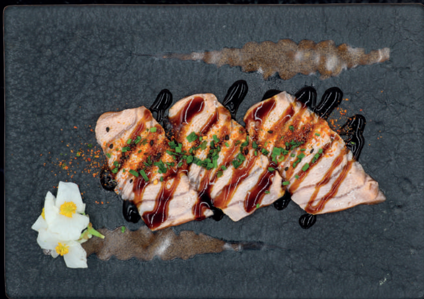
122. FLAMBERET LAKS MED CHILIPULVER (3 STK.)