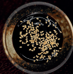
129. UNAGI SAUCE