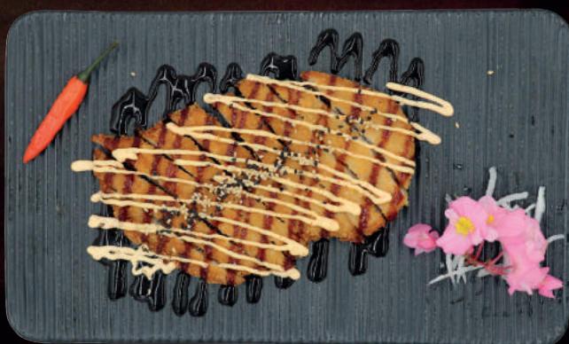
18. TEMPURA KYLLING Friturestegt kylling toppet med chilimayo og unagi sauce