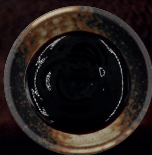
130. TERIYAKI SAUCE