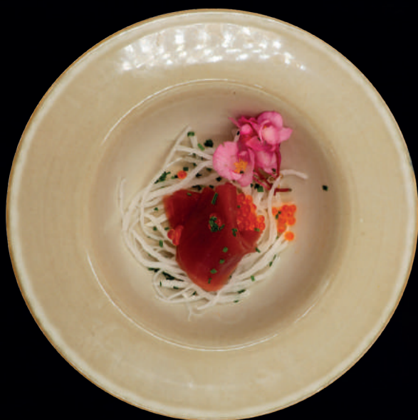
123. TUN SASHIMI (3 STK.)