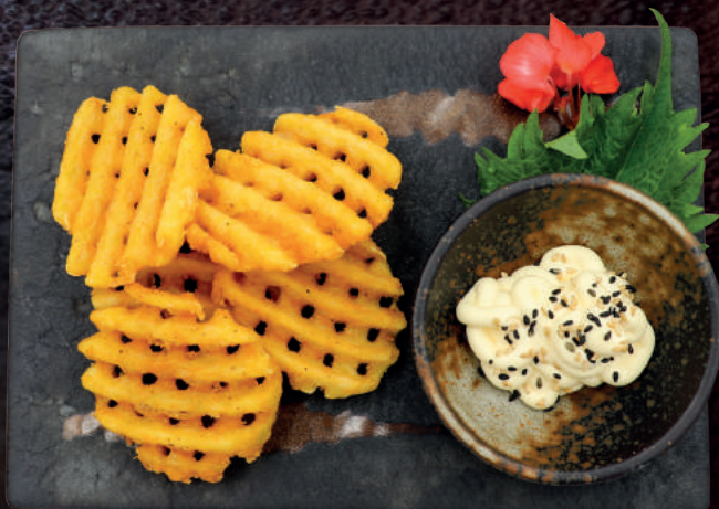
16. KARTOFFELRUDER Med mayonnaise