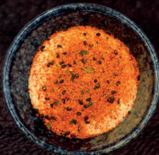
128. CHILIMAYO 🌶️